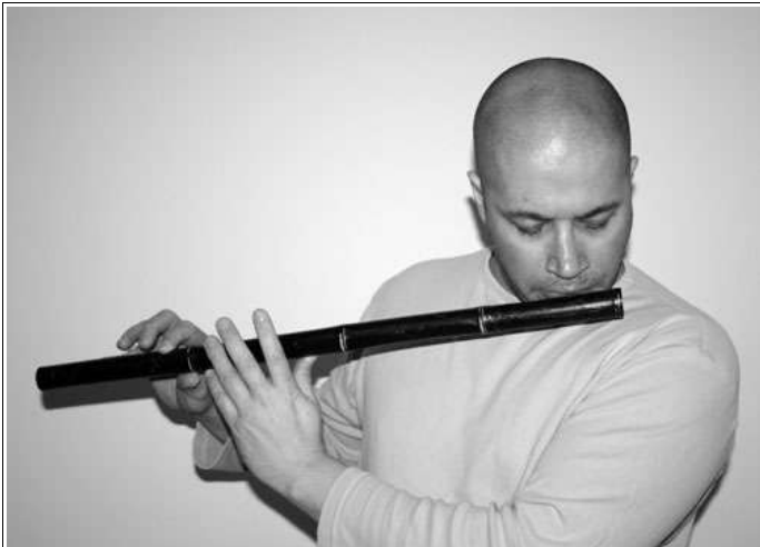
Abbildung 9 Nun müssen wir das Loch Nr. 6 öffnen um das Bb zu spielen. Damit die Flöte uns nicht aus den Händen fällt, kann man neben dem geschlossenen Loch Nr. 3, auch das Loch Nr. 4 schließen.