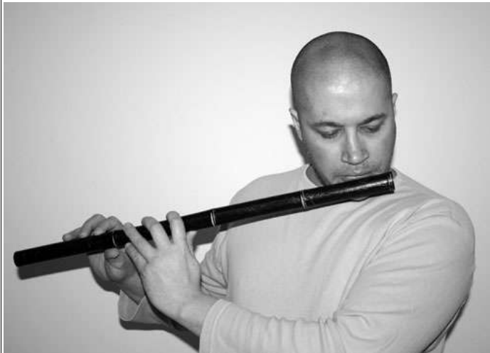
Abbildung 4 Für das C, schließen wir alle Löcher. Mit der rechten Hand werden die Unteren drei Fingerlöcher geschlossen und mit der linken Hand die oberen drei Löcher und das Daumenloch.