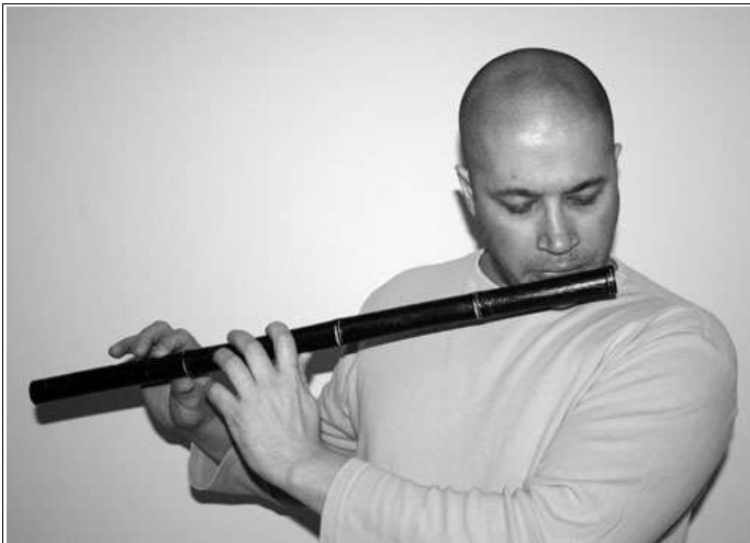
Abbildung 7 Vorsicht! Das Loch Nr 3 bleibt mit dem Zeigefinger geschlossen. Nun hebe ich den linken Ringfinger für das F#. Natürlich könnte man Loch Nr. 3 öffnen um das E zu spielen, ist aber nur für die Ornamentierung gedacht und nicht für die traditionelle indische Skala.