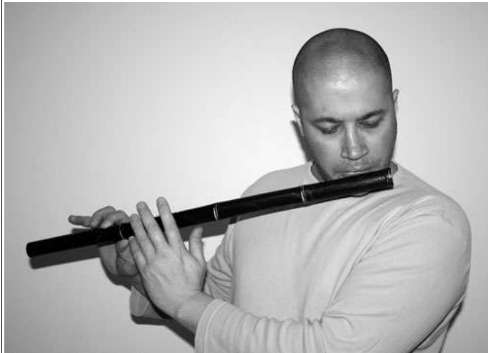
Abbildung 10 Zuletzt wird das Loch Nr. 7, also das Daumenloch geöffnet. Allerdings nicht wie hier im Bild, sondern ich schiebe lediglich den Daumen etwas zurück, so dass das Loch offen steht, aber der Daumen trotzdem an der Flöte gestützt ist.