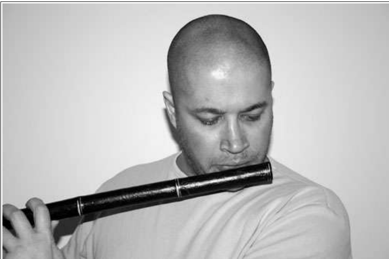
Abbildung 3 Die höhere Oktave wird durch ein leicht stärkeres Blasen mit einem engeren Luftspalt erzeugt.