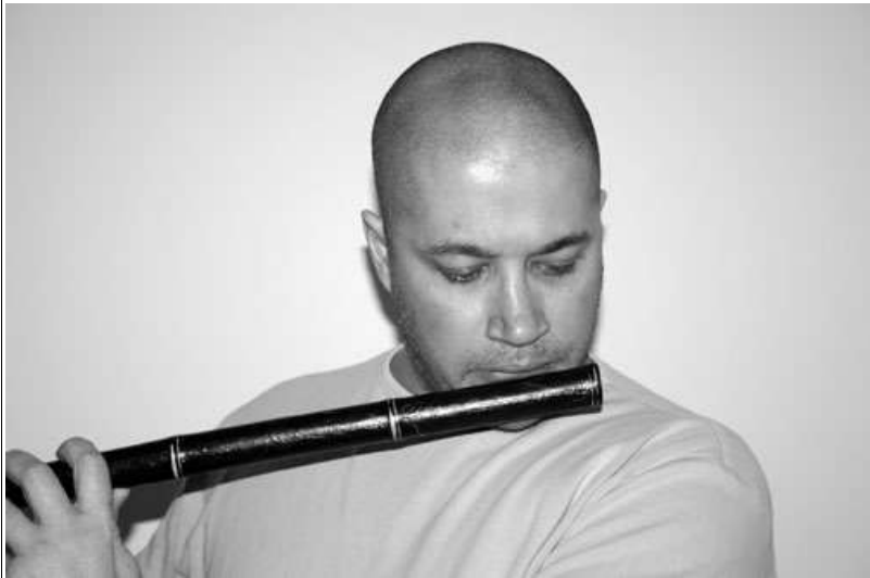
Abbildung 2 Der tiefere Ton wird durch leichtes Blasen mit einem breiteren Luftspalt gespielt.